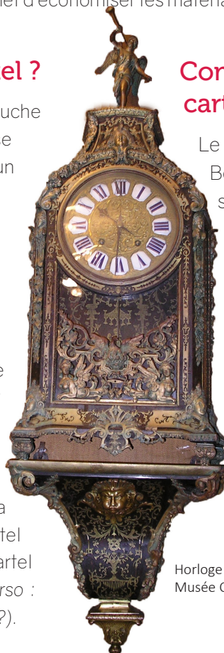
Horloge style Louis XIV à la manière Boulle Musée Charles-Friry

Le cartel Louis XIV réalisé façon Boulle est très reconnaissable par sa forme : le boîtier mécanique est rectangulaire , surmonté d'une statuette à l'antique et les pieds reposant sur une corniche de forme pointue. Le tout est richement orné . La marqueterie aide aussi à reconnaître un cartel Boulle puisqu'elle est très caractéristique.